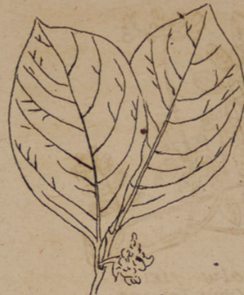
Diospyros - Maki (Maki Baum).