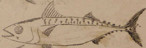
Saba (comber cclias)