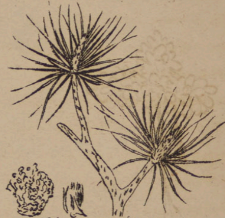
Pinus densiflora (Kiefer).