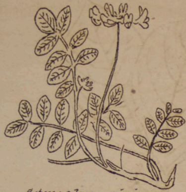
Astragalus sinicus (chin. Tragant).