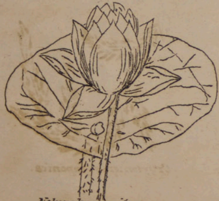
Nelumbo nucifera (Lotus).