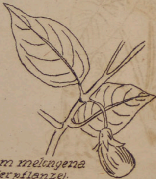
Solanum melongena (Eierpflanze).