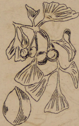
Ginkgo - biloba (Gingho - Baum).