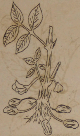
Arachis hypogaea (Erdnuß).