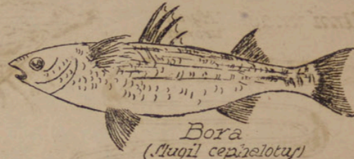
Bora ( Mugil cephalotus )