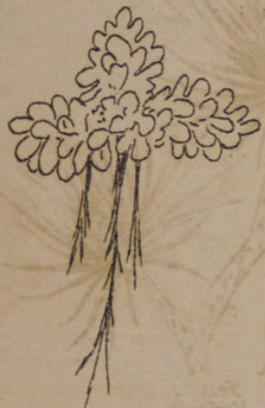
Azolla pinata (Wasserfarn 15x vergr.).