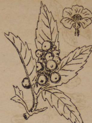
Eriobotrya - japonica (Biwa - Baum).