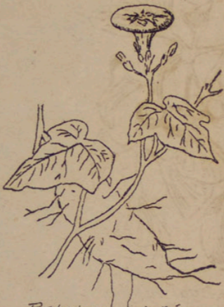
Batatas edulis (Süß-Kartoffel).