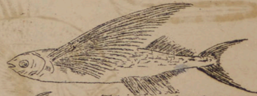
Tobiu (wjo) ( Gypselurus agoo )