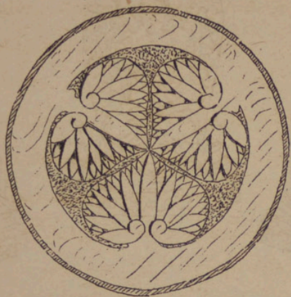
Wappen der Familie Tokugawa, Holzschnitzerei an der Türe des Tempels Daiinji.