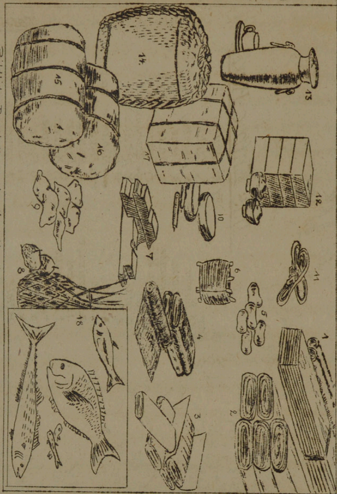
Bildliche Darstellung des Ken-Handels